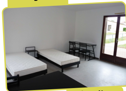
Plan d'un logement étudiant