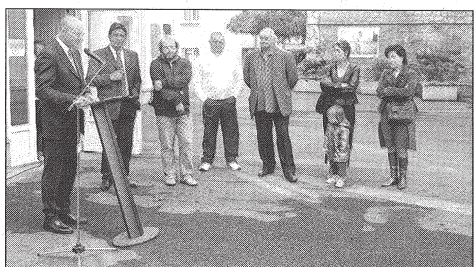
Inauguration en plein air dans ce havre de paix en pleine ville qu'est l'îlot Bourbon.

n° 13 à 23, rue Salvador-Allende à Sedan ; du 2 au 14 novembre, cour des bâtiments 62 et 64, rue Vincent-Auriol ; du 16 novembre au 4 décembre, rue Nobel à Rethel ; du 6 au 19 décembre, 29-39, rue Léon-Dehuz ; du 21 décembre au 4 janvier, porche du 1442, rue Jean-Macé à Revin.