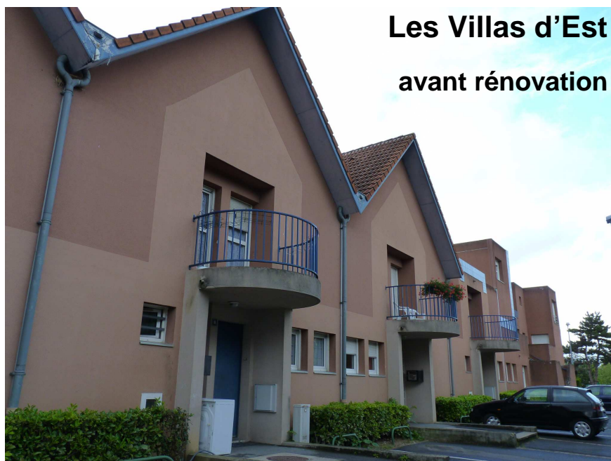
Les Villas d'Est avant rénovation