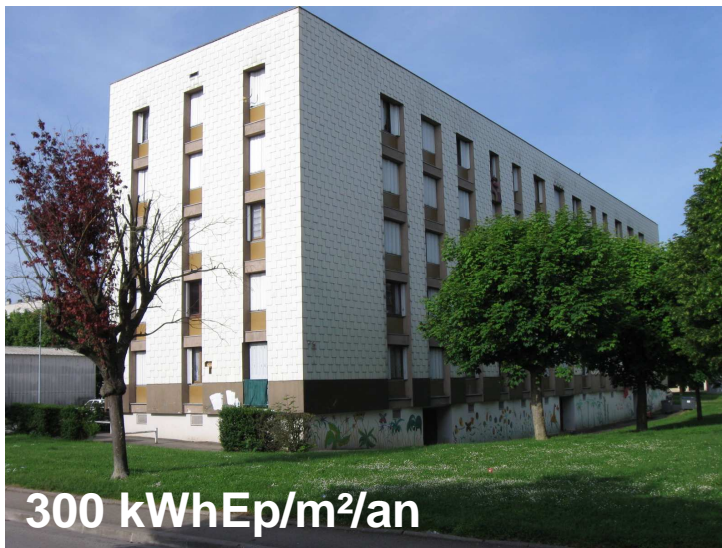
Rue des Sénardes