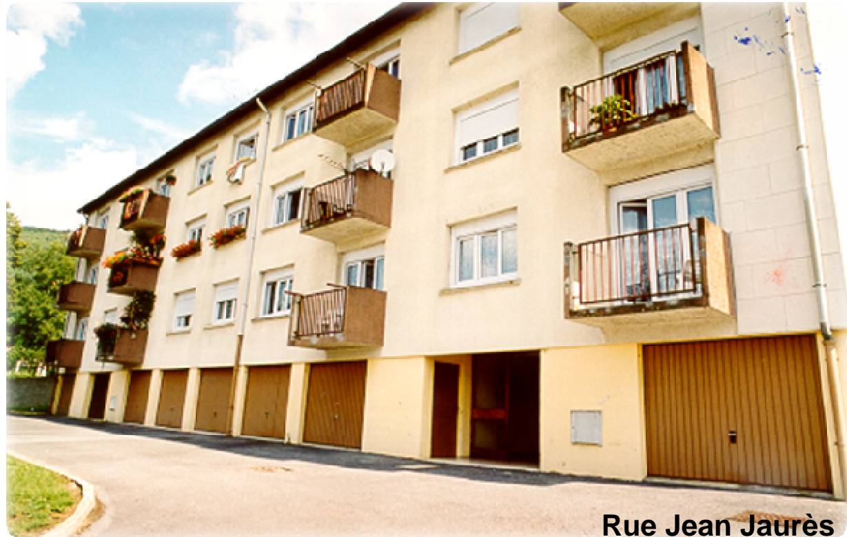
Rue Jean Jaurès

Isolation de façade constituée de plaques de polystyrène expansé de 100mm d'épaisseur recouvertes d'un enduit. Fixation en mode calé-chevillé.