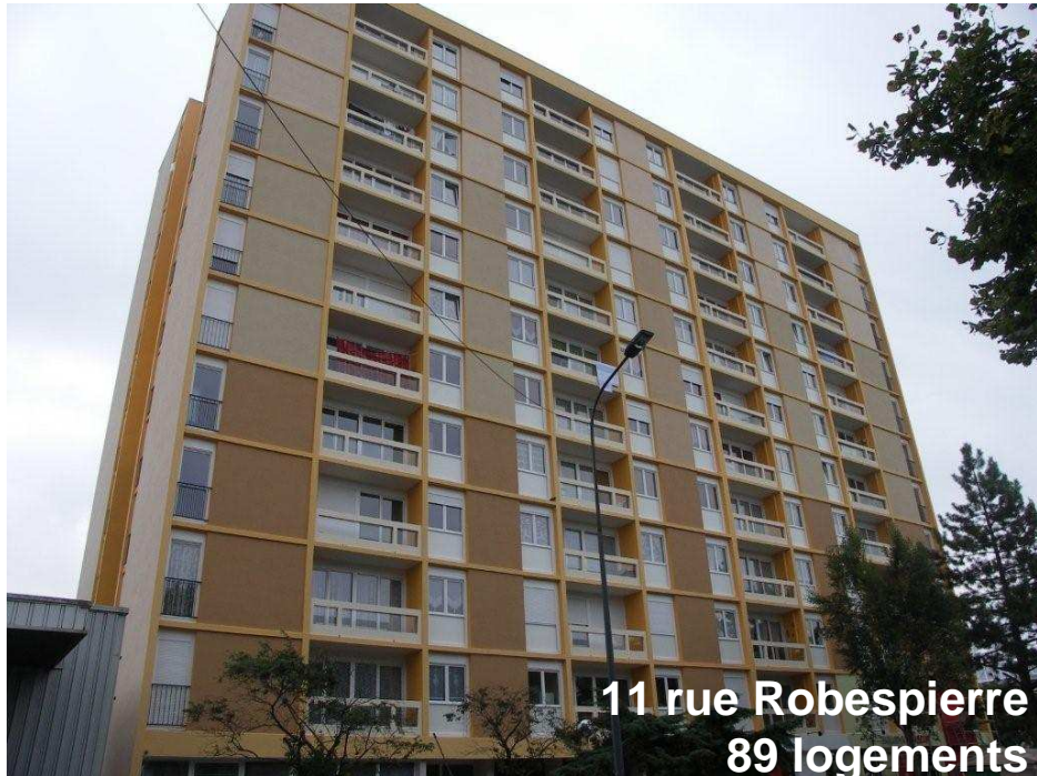
11 rue Robespierre 89 logements