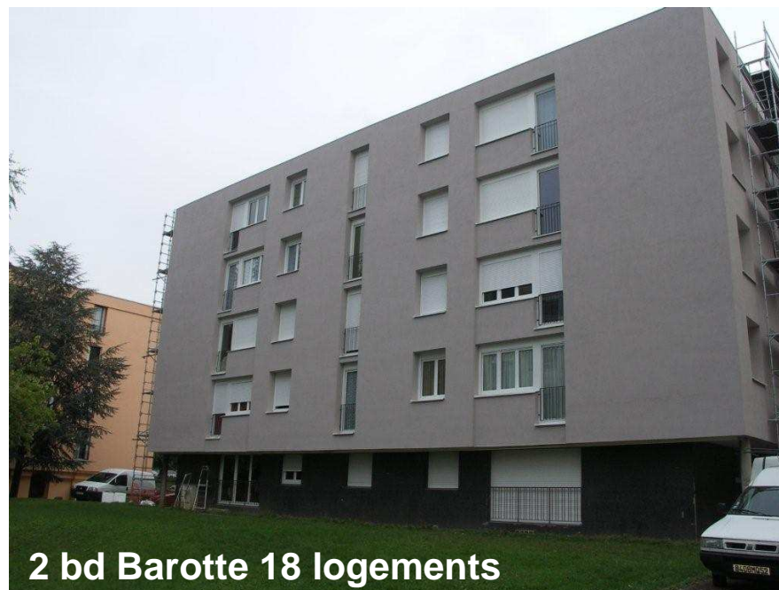
2 bd Barotte 18 logements