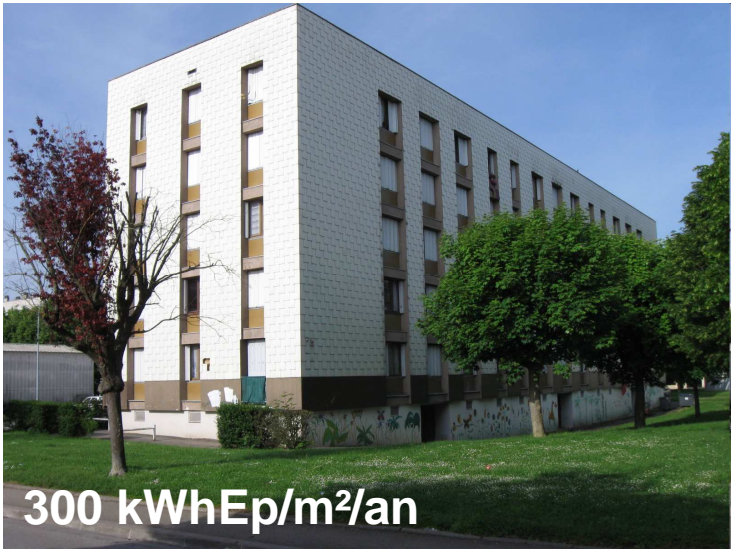
Rue des Sénardes