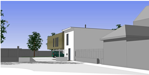
Troyes, 5 logements Bernard Gelin, Espace concept Phase DCE

isolation par l'intérieur, par l'extérieur, répartie.