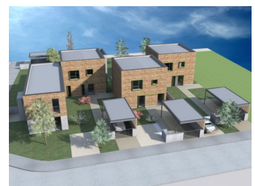
Fagnières, 16 logements Grzeszczak et Rigaud architectes Phase esquisse