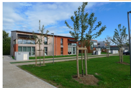
Les maisons à ossature bois de Loos en Gohelle (62), Villavenir Nord Pas de Calais

Plus d'informations sur l'opération du Nord Pas de Calais sur www.villavenir.fr