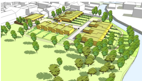
Bazancourt, 15 logements Vincent Toffaloni et KL architectes Phase esquisse