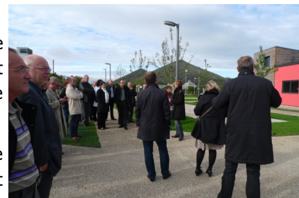
Villavenir Champagne-Ardenne en visite dans le Nord Pas de Calais