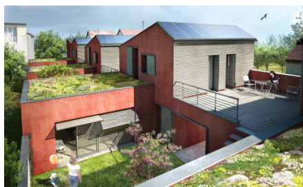
Épernay, 6 maisons Atelier D Phase esquisse